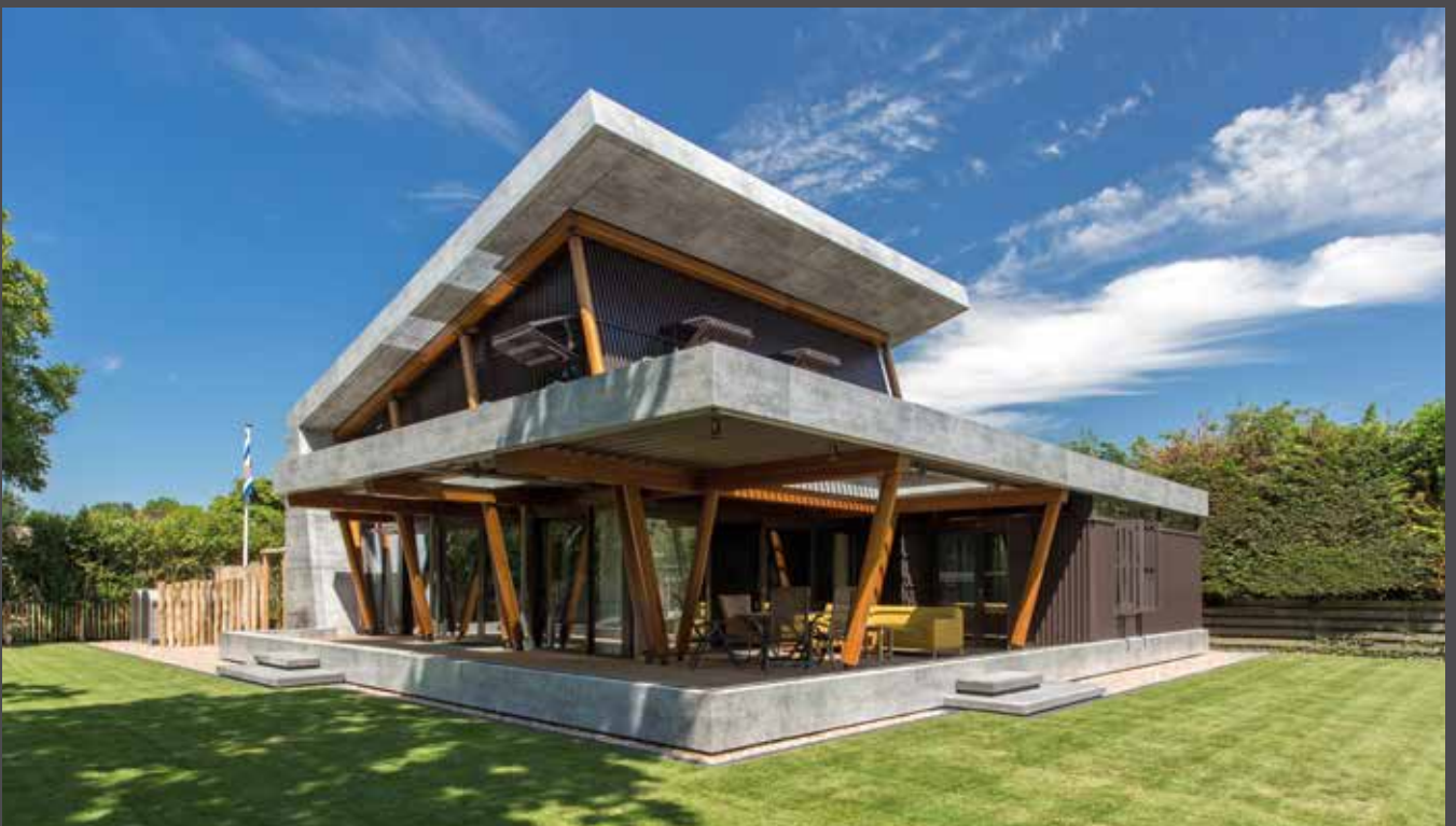
Holiday Home, Pays-Bas | Matériau/ Materiale: ALUCOBOND® PLUS vintage Rough Concrete | Architecte/ Architetto: Architektenburo TEN HOVE B.V. Transformateur/Trasformatore: MZAllpro | Installateur/Installatore: Cladding Partners B.V.