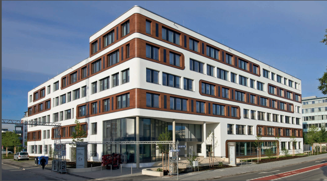
Nature-loving: Excellent CO 2 balance and sophisticated wood look in ALUCOBOND® composite panels at the NU-Office in Munich. | Der Natur verbunden: Das NU-Office in München überzeugt mit einer hervorragenden CO 2 -Bilanz und mit der edlen Holzoptik von ALUCOBOND® Verbundplatten. | Architect: Architecture Office Falk von Tettenborn

We love wood. And we also love sophisticated architecture. That was our reason for developing top-quality structured ALUCOBOND® Ligno cladding panels, which combine all the natural beauty of wood and all the benefits of ALUCOBOND® aluminium composite panels.