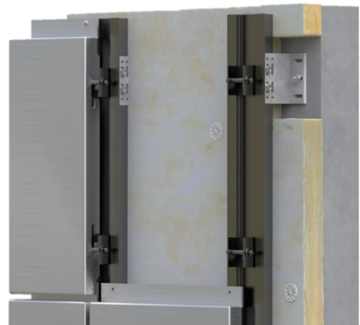
Cassettes à encoches pour fixation invisible