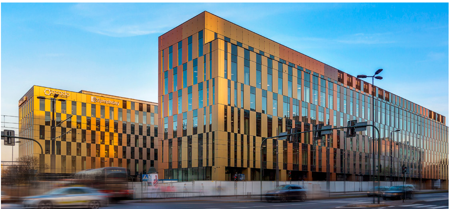
High Five Offices | Krakow, Poland | STB - E03, STB - 4B3