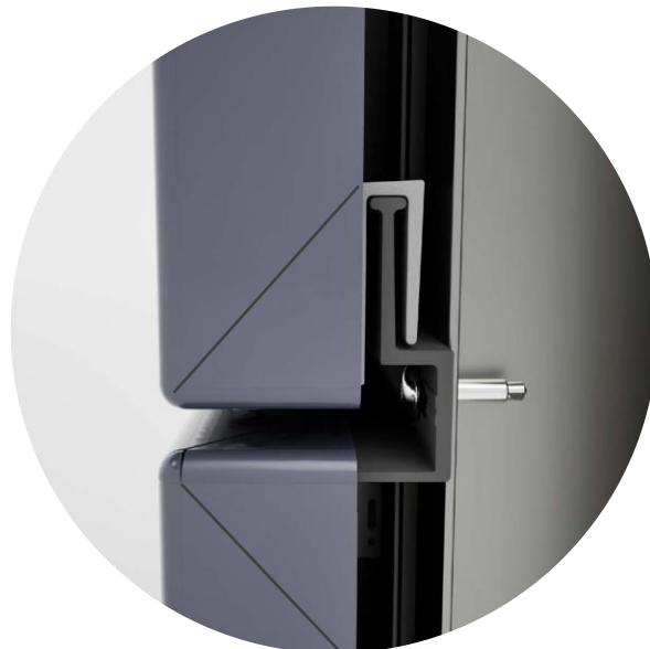
Cassettes à emboîtement par profil SZ